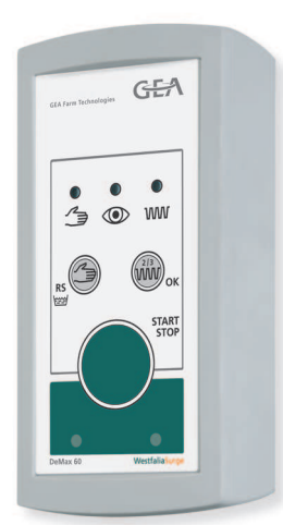
Pod názvom DeMax 60 sa skrýva maximálny komfort pri sťahovaní.